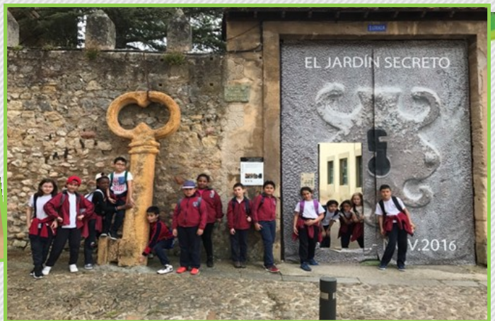
Excursión al valle de Caderechas y Orña