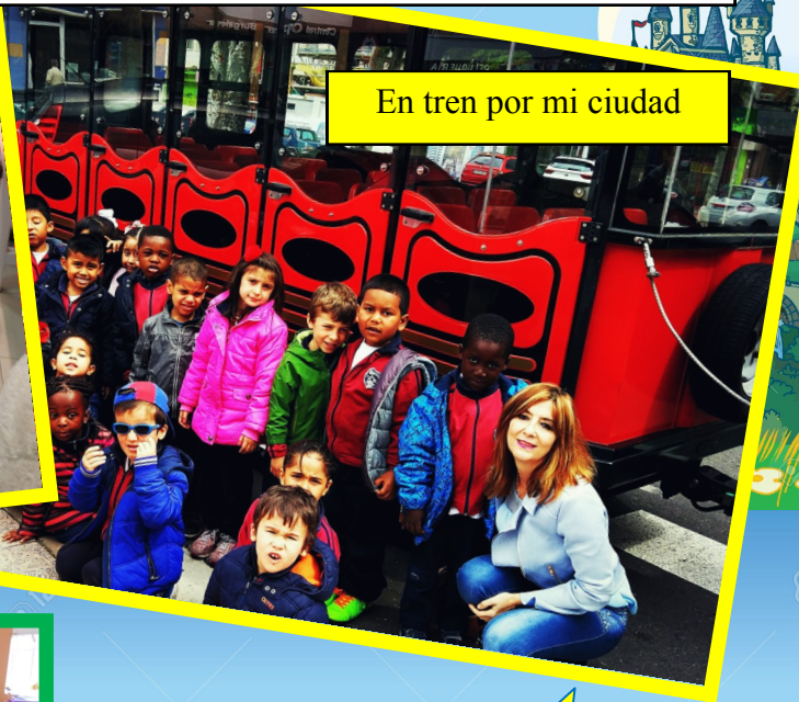
En tren por mi ciudad