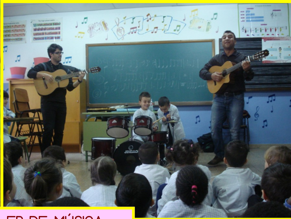
TALLER DE MÚSICA