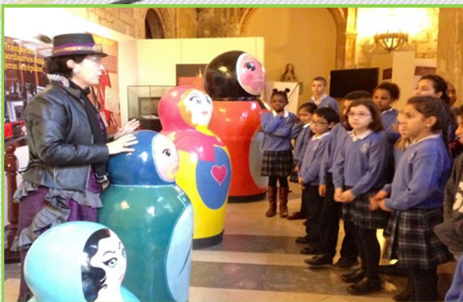
Visitamos el Salón del Libro Infantil. Este año conocemos a Julio Verne.