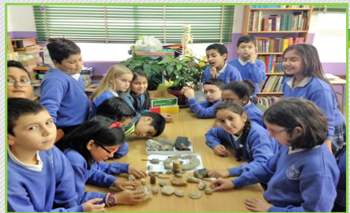
En clase de Sociales estudiamos los fósiles.