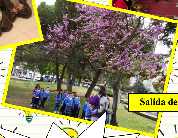
Salida de las estaciones