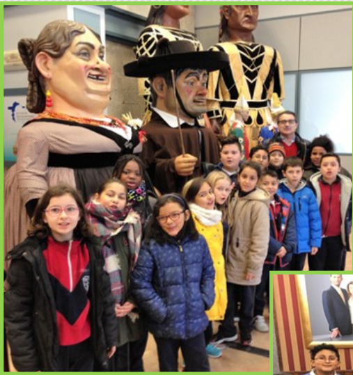
Casa de los Gigantillos