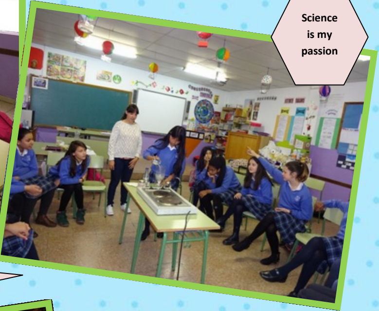
Science is my passion