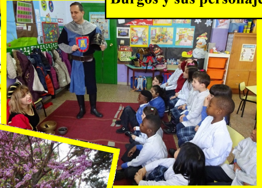
Burgos y sus personajes