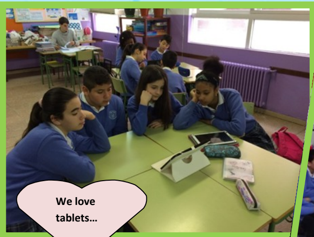
We love tablets...