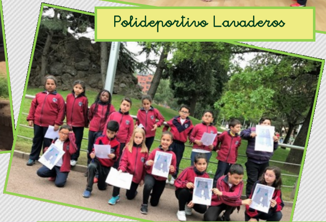
Juegos de Orientación en el Parque Félix