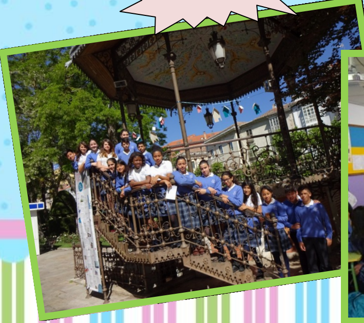
En la Feria del Libro.