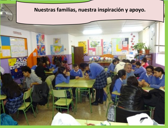
Nuestras familias, nuestra inspiración y apoyo.