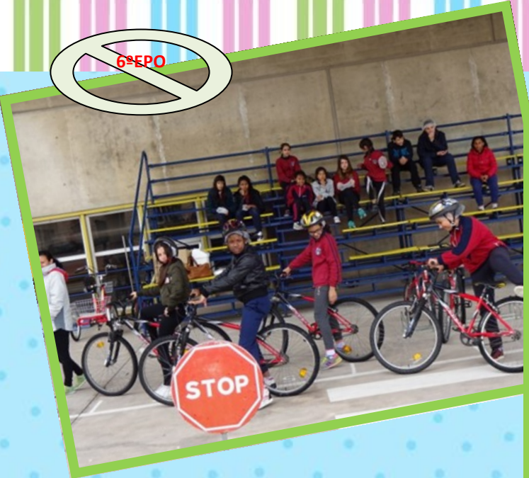
Nos queda tanto por aprender...