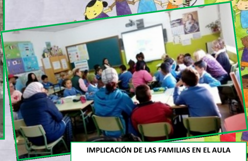
IMPLICACIÓN DE LAS FAMILIAS EN EL AULA