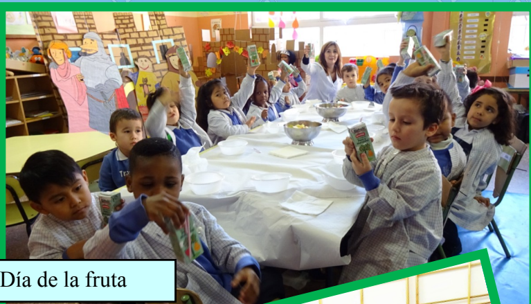
Día de la fruta