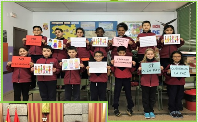
Día de la Paz