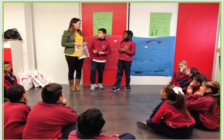
Taller sobre la paz y la convivencia.