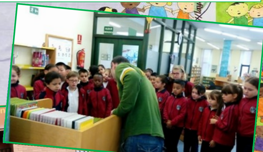
BIBLIOTECA GONZALO DE BERCEO