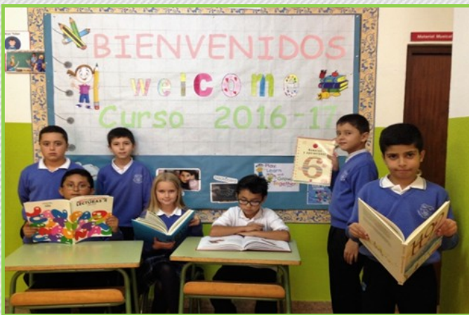
Comienzo del curso con ganas e ilusión