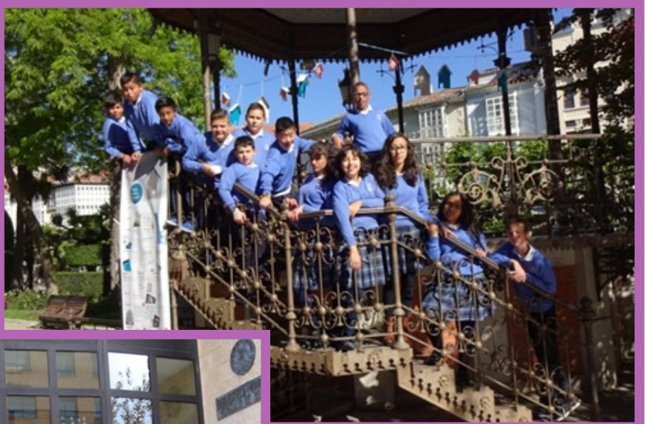
FERIA DEL LIBRO