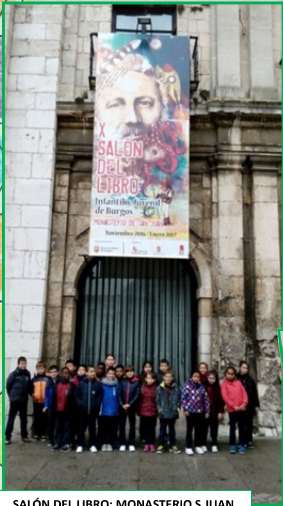
SALÓN DEL LIBRO: MONASTERIO S.JUAN