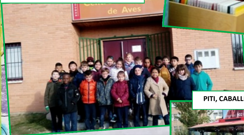
CENTRO DE DIVULGACIÓN DE AVES

Así mismo, hemos compartido juegos en la "Operación Bocata" y en la excursión de fin de curso a Las Caderechas con nuestros compañeros de 4º de EPO.