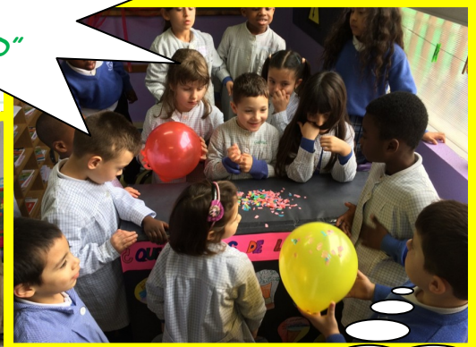
Hacemos magia con la electricidad estática.