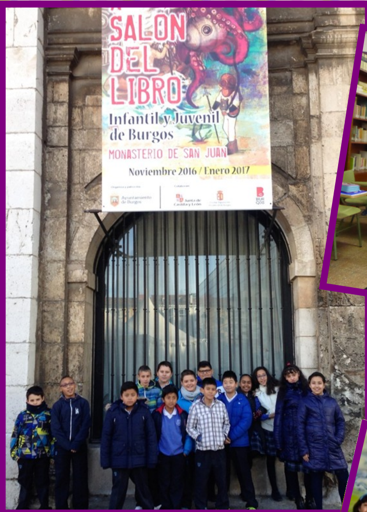
SALÓN DEL LIBRO