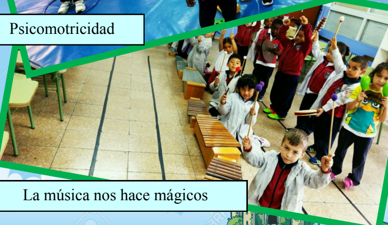
La música nos hace mágicos