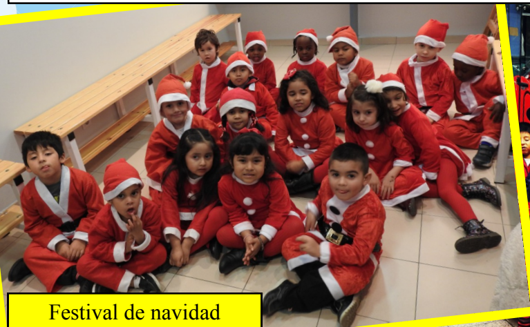
Festival de navidad