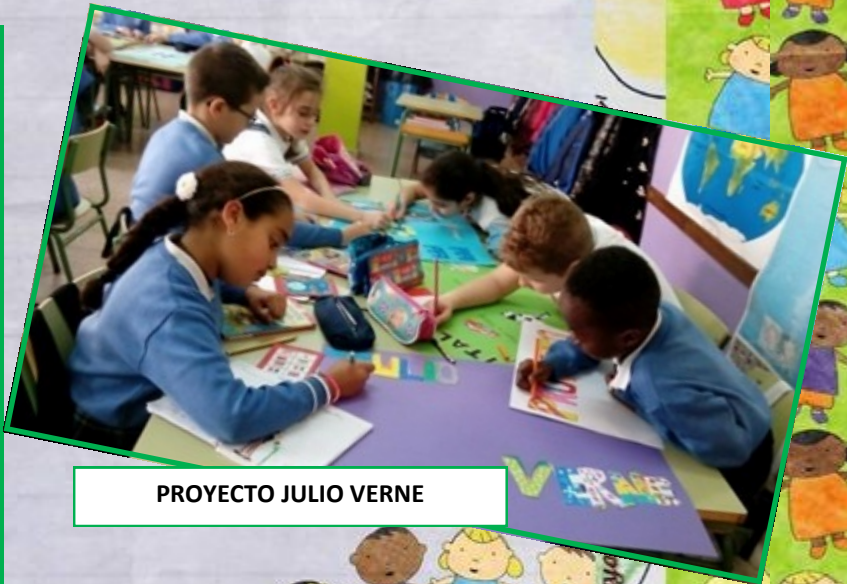
PROYECTO JULIO VERNE