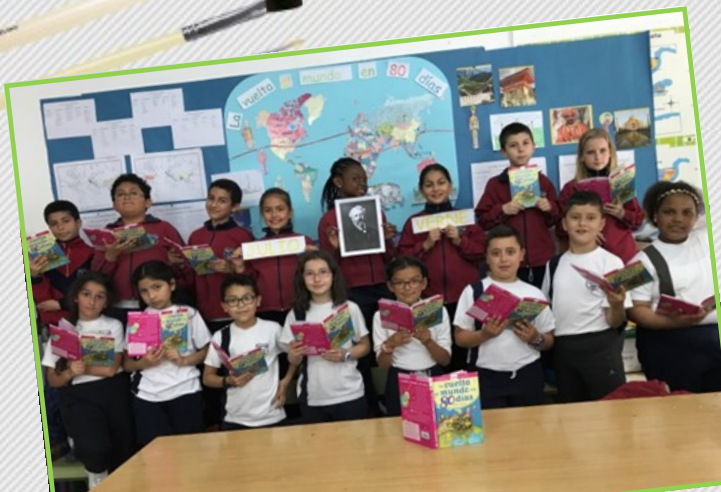
"La vuelta al mundo en 80 días"