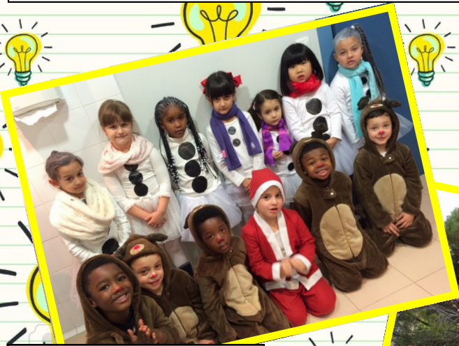
Festival de Navidad