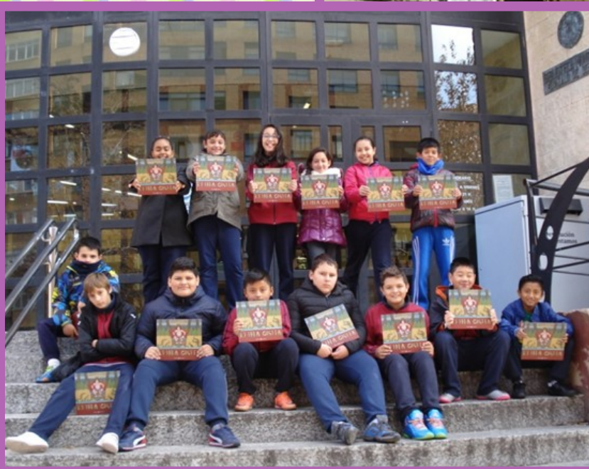
BIBLIOTECA GONZALO DE BERCEO